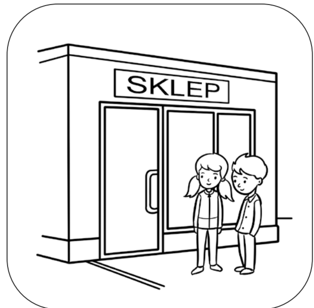
Dzieci stoją przed sklepem.