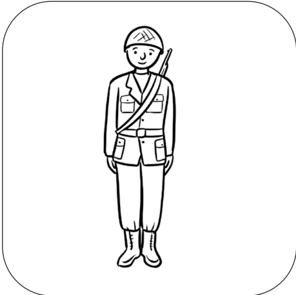
Żołnierz stoi na baczność.