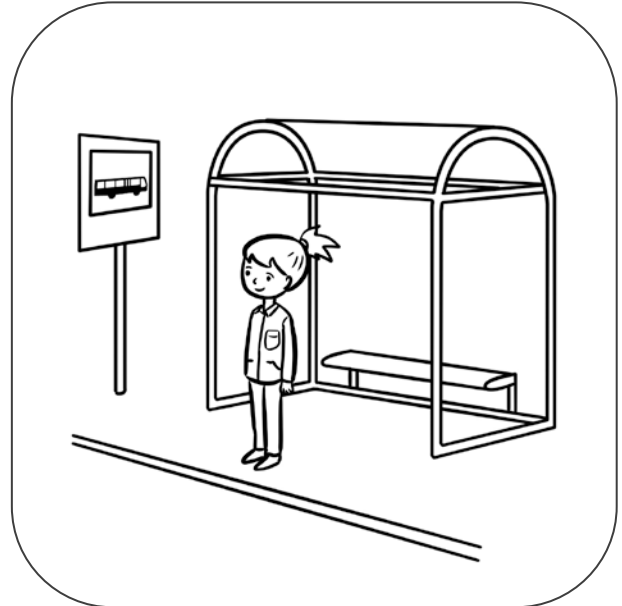
Dziewczynka stoi na przystanku.