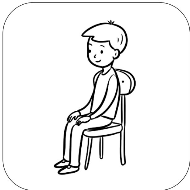
Chłopiec siedzi na krześle.