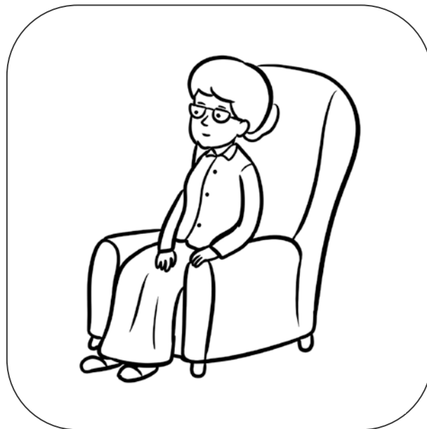
Babcia siedzi w fotelu.