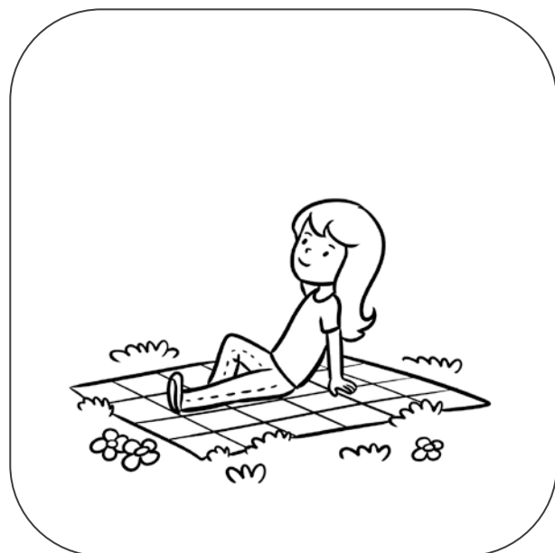
Dziewczynka siedzi na kocu / na łące.