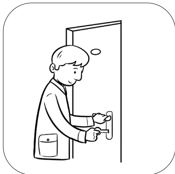
Tata otwiera kluczem drzwi.