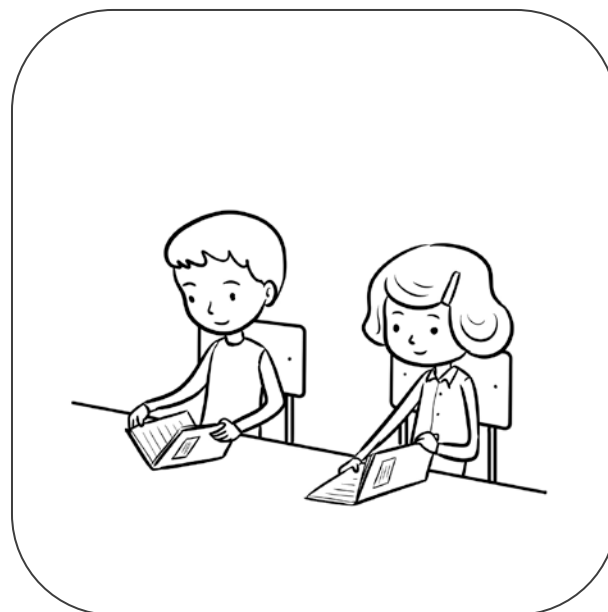
Dzieci otwierają zeszyty.