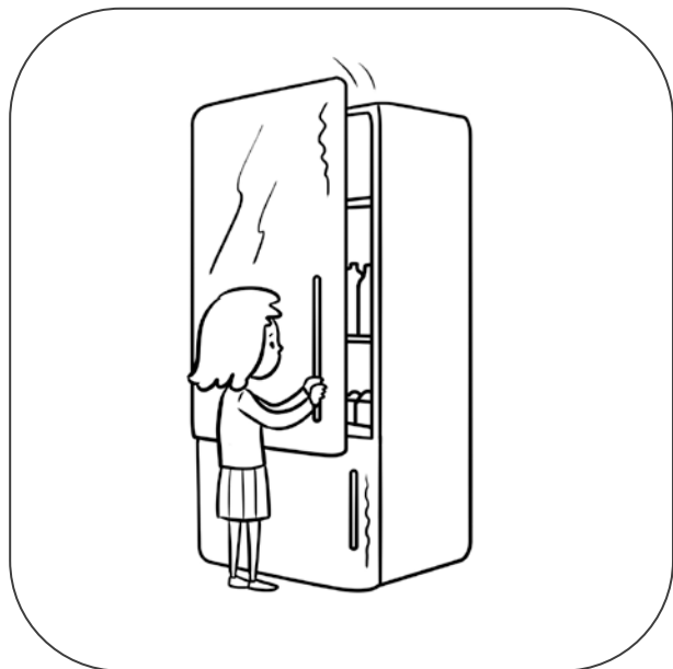
Dziewczynka otwiera lodówkę.