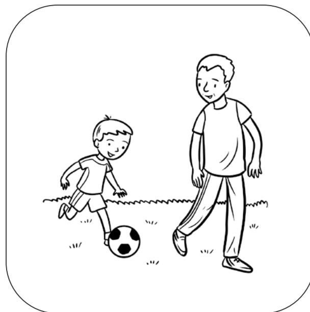
Tata gra z synem w piłkę nożną.