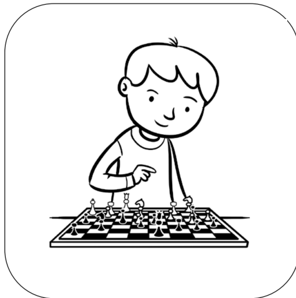
Chłopiec gra w szachy.