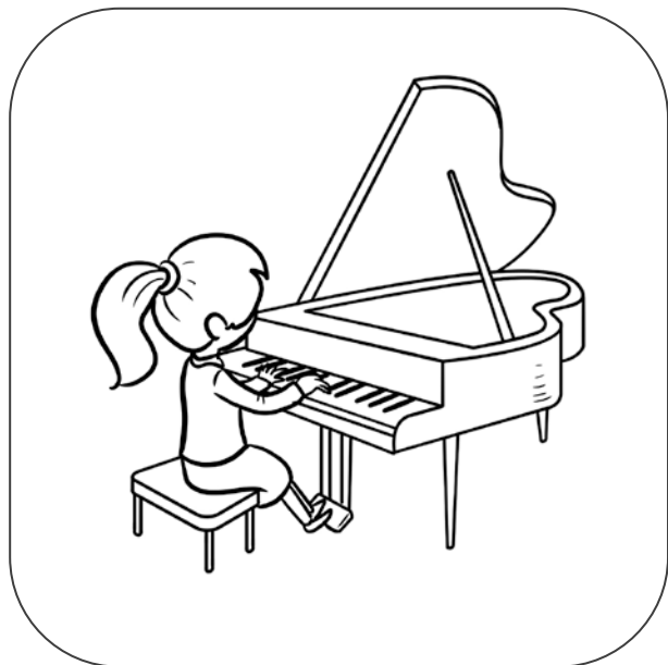
Dziewczynka gra na fortepianie.