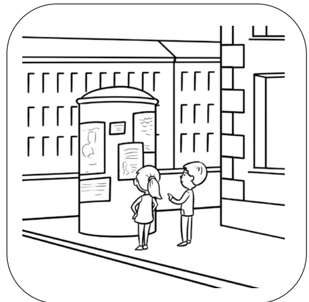
Dzieci czytają ogłoszenie na ulicy.