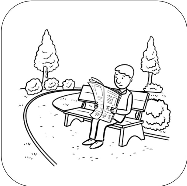
Pan czyta gazetę w parku.