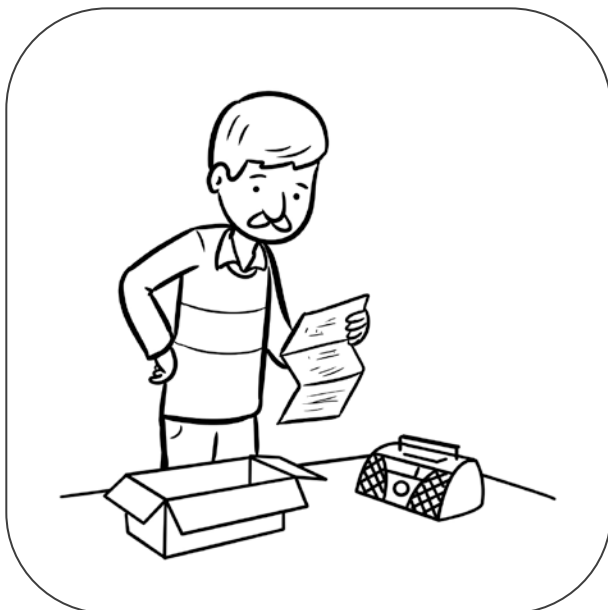
Tata czyta instrukcję obsługi radia.